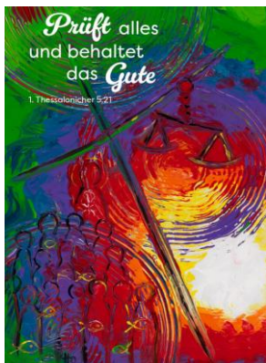
Grafik: © Gemeindebrief Druckerei

Das CVJM Programm wird vom CVJM Calmbach e.V. meist sechs Mal im Jahr vorwiegend als Informationsschrift für CVJM Mitglieder herausgegeben